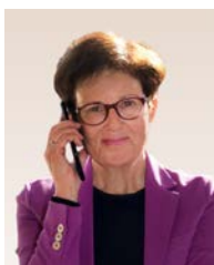
Gudrun Brendel-Fischer Komisarka za integracijo bavarske deželne vlade