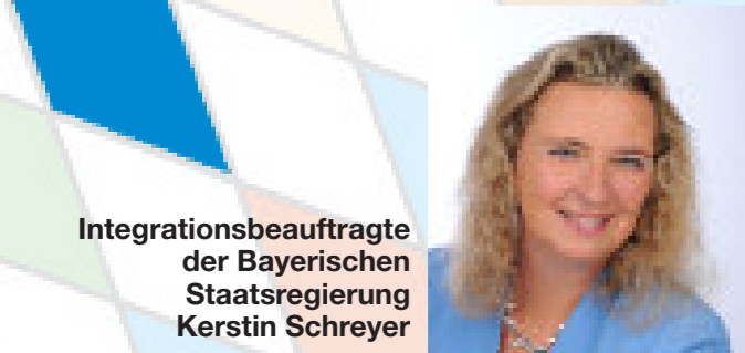
Integrationsbeauftragte der Bayerischen Staatsregierung Kerstin Schreyer

21.6. Welthumanistentag Im Rahmen einer Konferenz der Internationalen Humanistischen und Ethischen Union in Oslo wurde am 21. Juni 1986 dieser Tag schließlich als World Humanist Day („Welthumanistentag“) zum offiziellen Feiertag für Menschen ausgerufen, die ihr Leben ohne Orientierung an religiösen Vorstellungen und auf Grundlage einer humanistischen Lebensauffassung führen. Der Feiertag soll auch dazu dienen, an die zentralen Werte, Ideen und Prinzipien einer humanistischen Lebensauffassung zu erinnern: vernunftorientiertes und rationales Denken, Selbstbestimmtheit, Individualität, Solidarität und Mithilfe sowie die Überzeugung, dass alle Menschen nur ein einziges Leben besitzen.